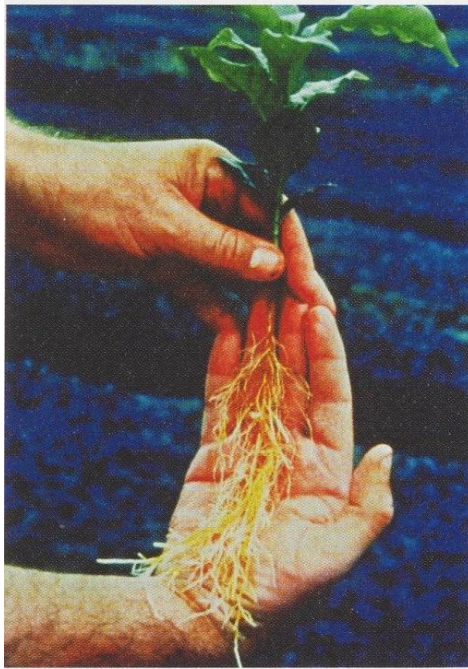
Junge Kaffeepflanze mit Wurzel

Für PiKa wird nur ein qualitativ sehr hochwertiger Rohkaffee verwendet. Das garantiert unsere Partnerin Fair Handelshaus GEPA, die den durchweg biologisch angebauten Kaffee nur aus den besten Anbaugebieten Lateinamerikas bezieht.